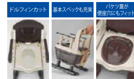
『安寿』独自のイルカの口先の様な形状のドルフィンカットが理想的な排泄姿勢に導きます。

標準タイプ: 重量/約10.5kg 安寿 ポータブルトイレ 2 KX-SDR 187-T0042 533-172 標準タイプ ●材質/ポリプロピレン、ウレタンフォーム、合成皮革、ポリエチレン、●生産国/日本 ●標準機能/ひじ掛け高さ調整(2段階/3cm)、便座高さ調整(無段階)、オイルダンパー ●抗菌 ●要組立