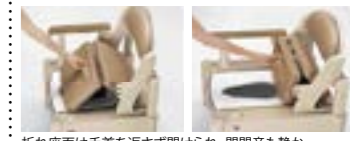
折れ座面は手首を返さず開かれ、閉閉音も静か。